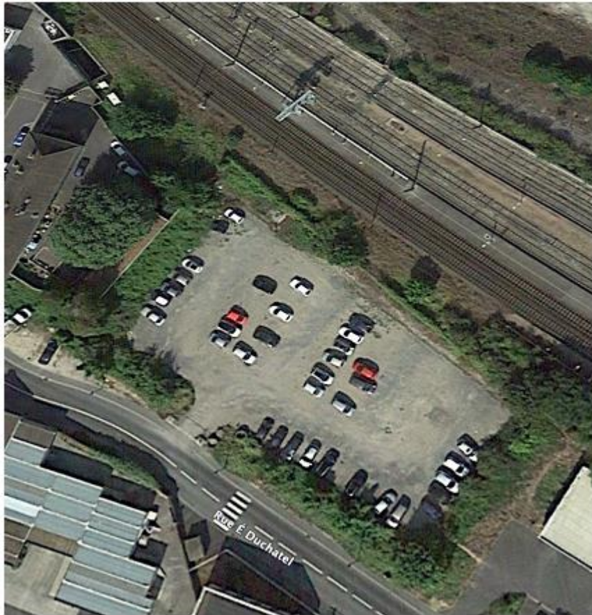
Parcelles cadastrées n°205 et 207, section AH à Epemay (51)